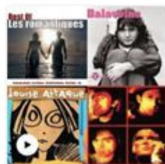
Blind test chanson française Publique