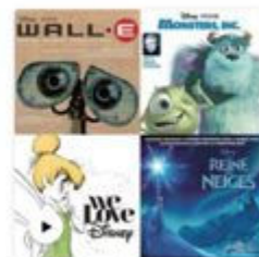
Blind test Disney Pixar Publique